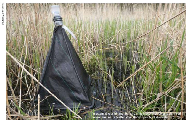
Insectenviel voor het monitoren van de insectenrijkdiversiteit in een perceel met natte teelten door HAS Hogeschool studenten