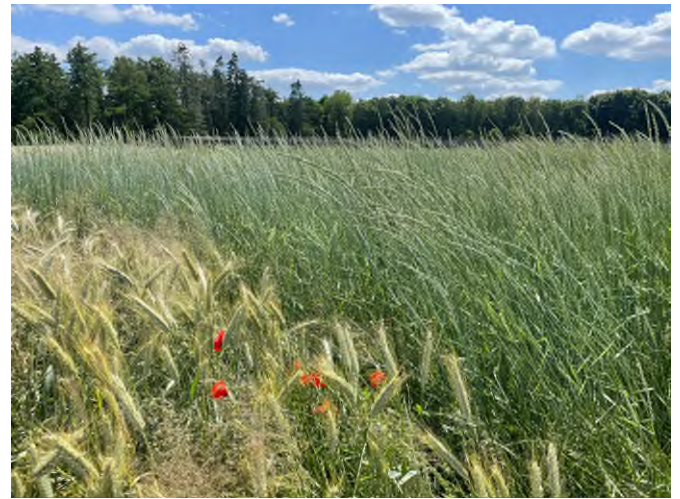
Foto links; meerjarig graan na vestiging in het eerste jaar. Foto rechts; meerjarig graan in de aar, op de voorgrond triticale.